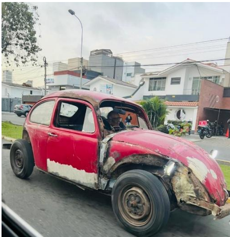
Foto 8. Un adulto mayor no sólo activo en su entorno, sino manteniendo su “bólide VW” de 1974 aún activo y en circulación. Con entusiasmo y lentes especiales para el “viento” a falta de parabrisas. Seguramente que el mismo lo arregla cuando presenta algún desperfecto (Lima, Perú).

Comentarios del Jurado. Nuevamente el arte aporta el placer de estar completamente en el presente. Y si bien parece que cada hombre estuviera absorto en su tarea, los une la proximidad de la presencia y el momento compartido, los colores y el aroma de la madera tallada que casi se puede respirar.