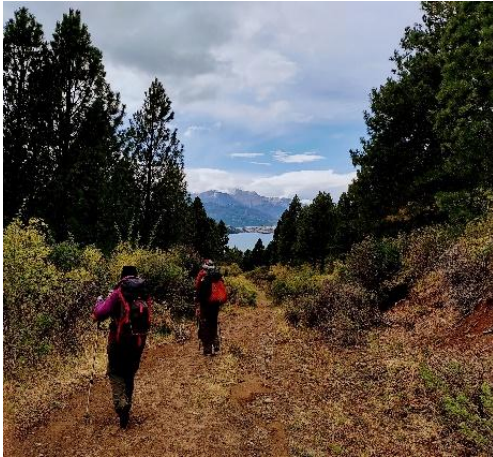
Cuarta mención. Foto 7. Dos caminantes mayores y el paisaje. Patagonia Argentina. Autora: Isabel N. Kantor