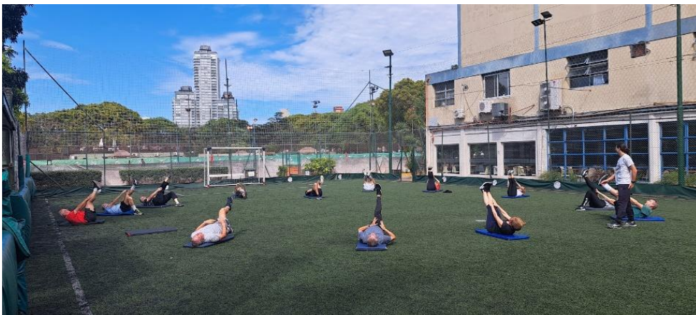
Foto 4. Activos y saludables con 60 a 83 años (en un club deportivo de Buenos Aires). Autora: Caty Iannello