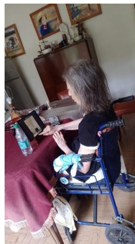
Foto 9. Artista plástico (1934), trabaja con materiales desechados.